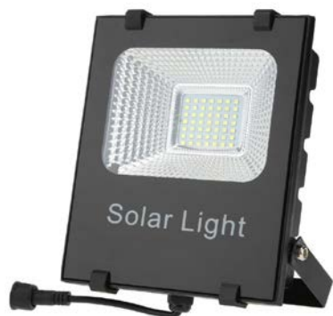
Reflector con Soporte