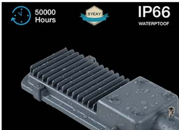
Grado IP66 de Protección al Exterior