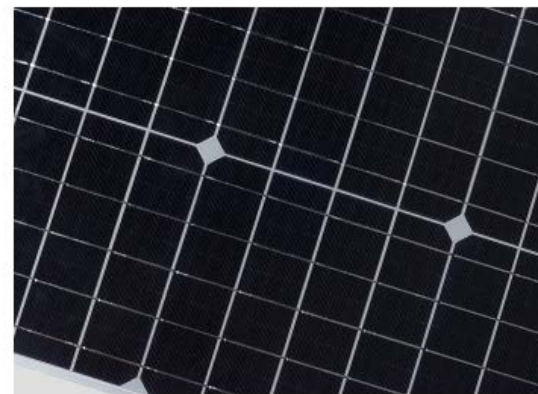
Panel Solar Monocristalino Importado