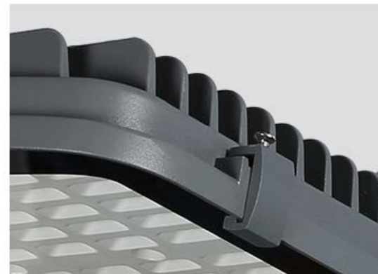
Housing de Aluminio de Alta Resistencia