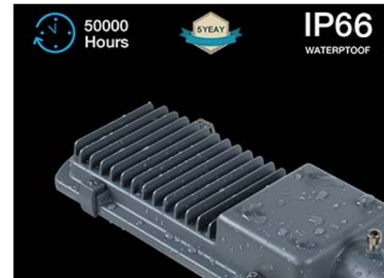
Grado IP66 de Protección al Exterior