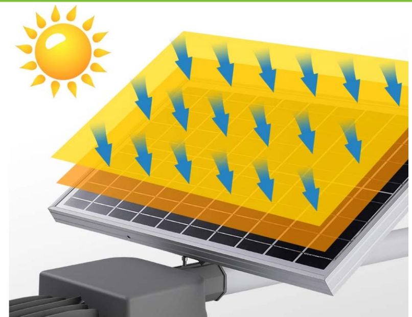
PANEL SOLAR DE ALTA EFICIENCIA