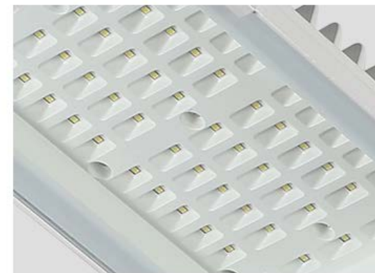
LEDS SMD 3030 de Alto Poder