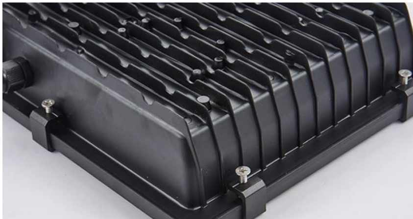
HOUSING DE ALUMINIO IP66