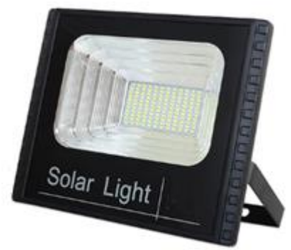
Reflector con Soporte