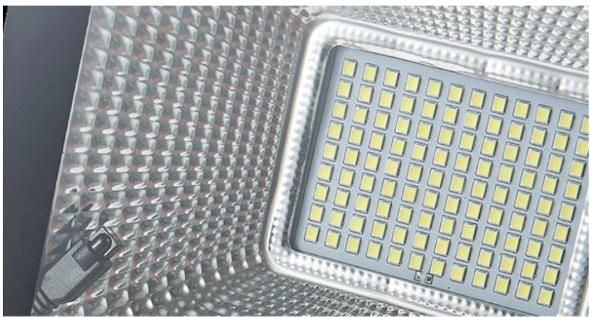
LEDS DE ALTA POTENCIA