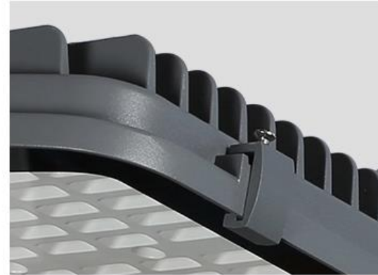
Housing de Aluminio de Alta Resistencia