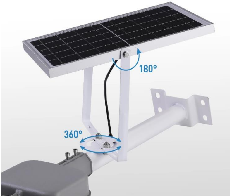
SOPORTE (TIPO A O B) GIRATORIO