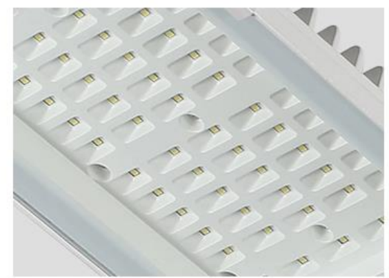
LEDS SMD 3030 de Alto Poder