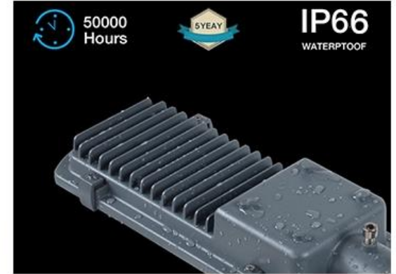
Grado IP66 de Protección al Exterior