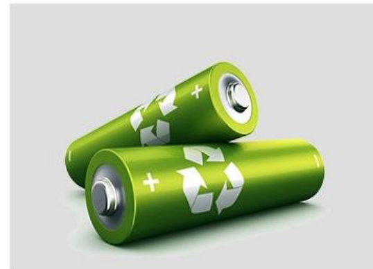
Batería de Litio Integrada