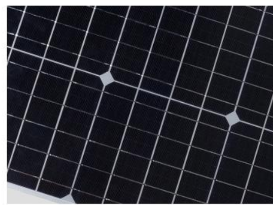
Panel Solar Monocristalino Importado